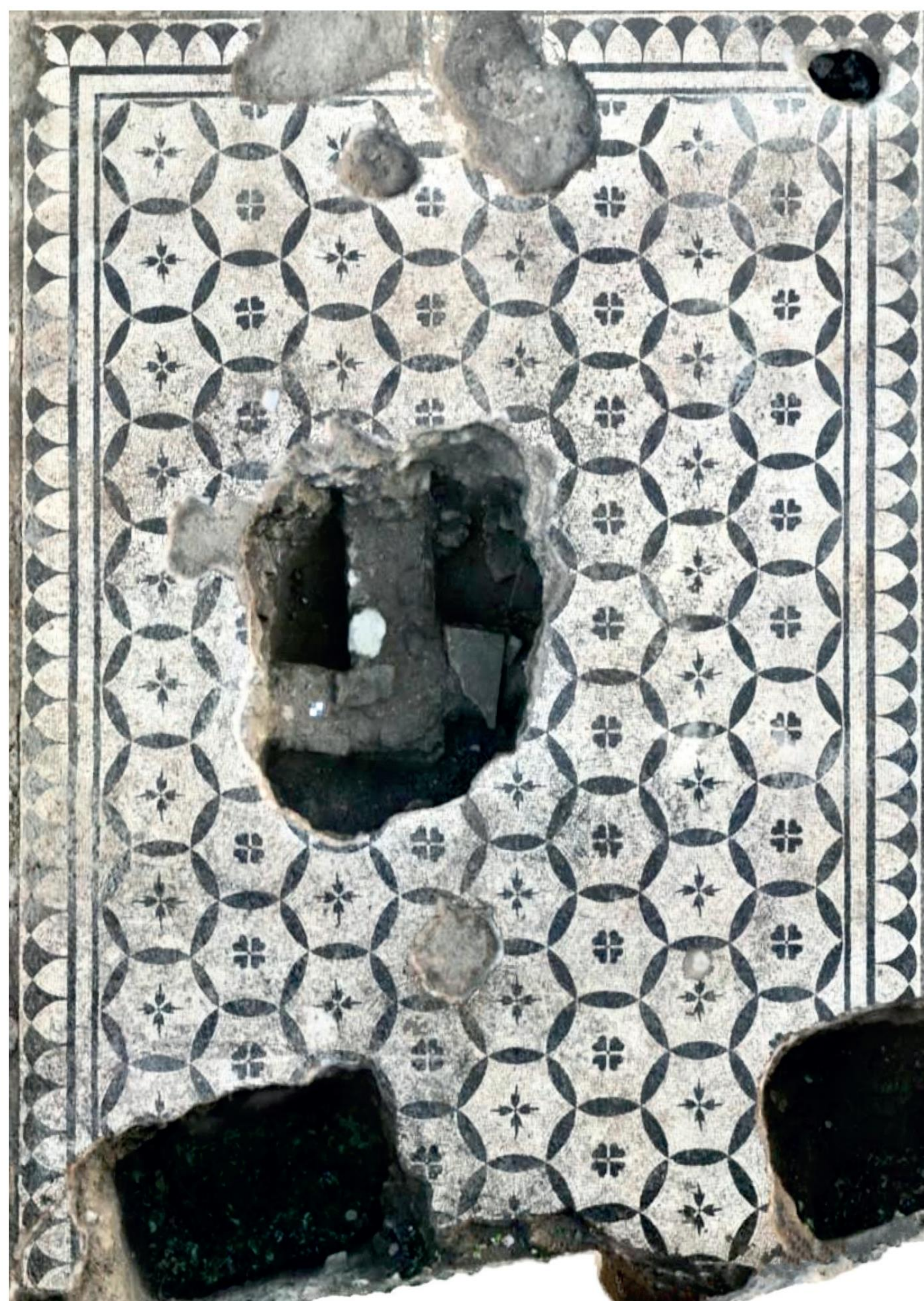
Fig. 4. Ambiente A1. Il pavimento in tessellato geometrico bianco-nero e, al di sotto, le strutture preesistenti intraviste dalla fossa centrale