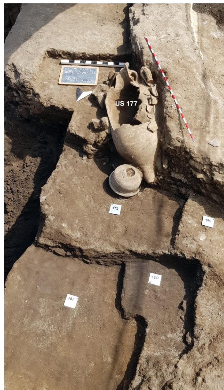
Fig. 3. La sepoltura infantile ad enchytrismòs all'esterno di A7