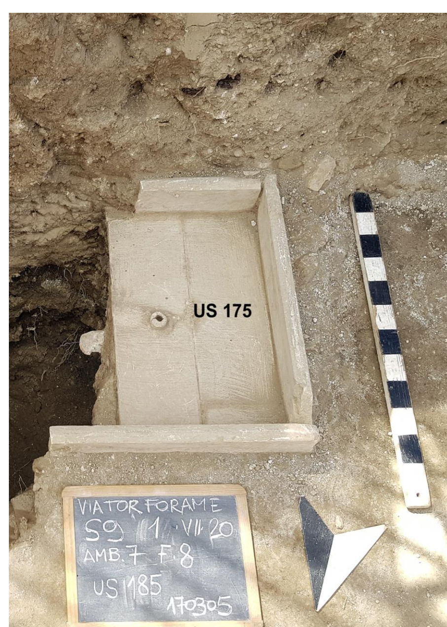
Fig. 2. A7. La vaschetta in lastre di marmo con fistula plumbea di adduzione idrica