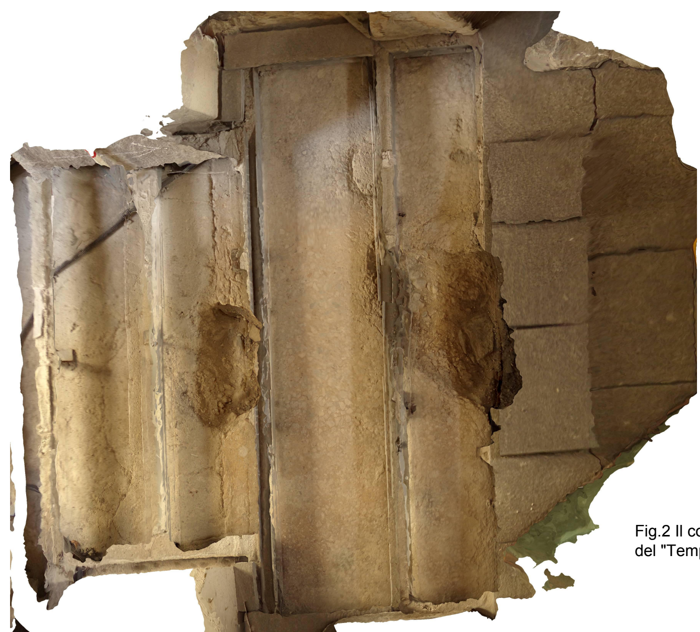
Fig. 2 Il cocchiopesto con inserti marmorei del "Tempietto di Roldo", Montecrestese