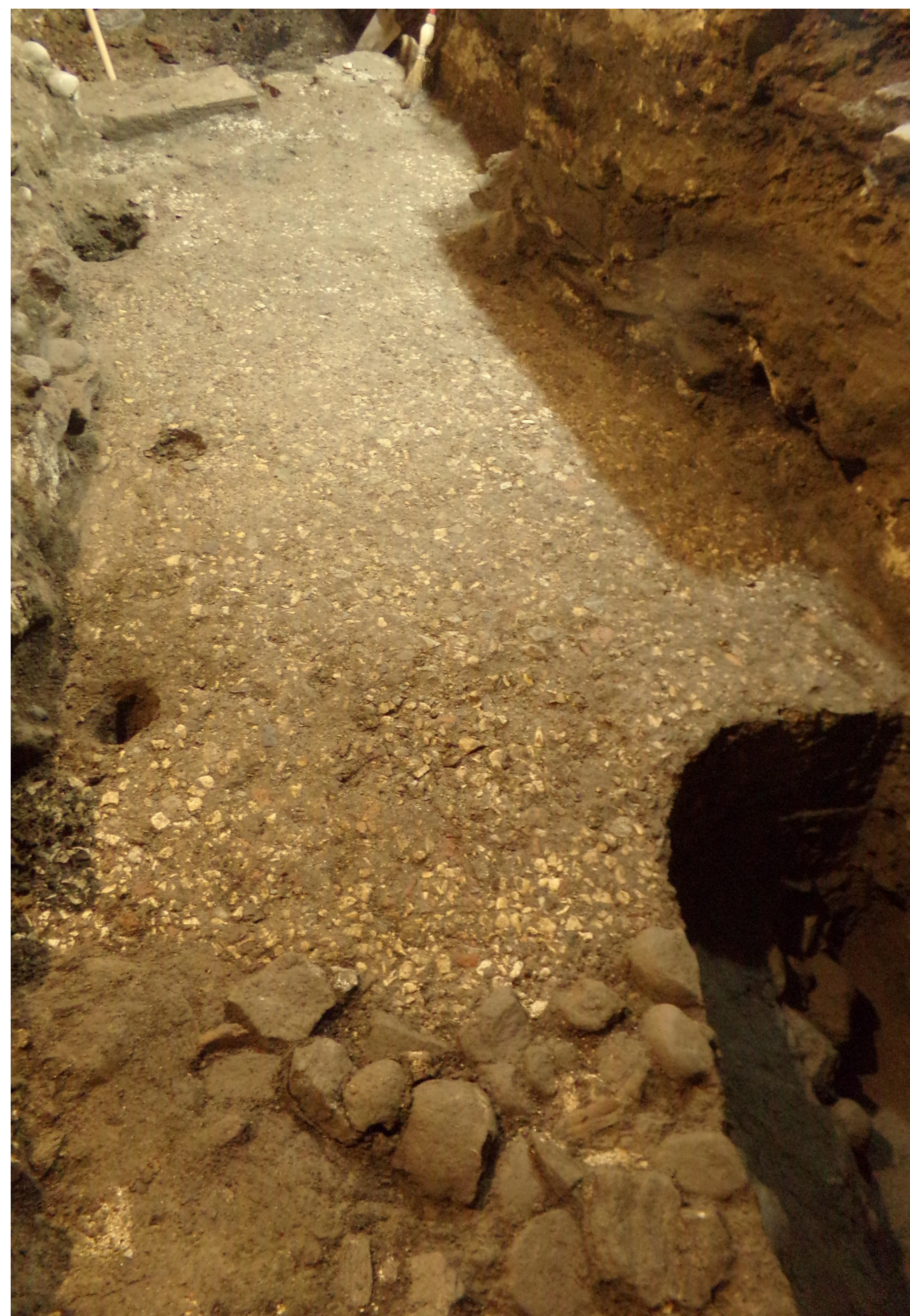
Fig. 3 Battuto con inclusi marmorei e litoidi. Scavo Teatro Galletti, Domodossola