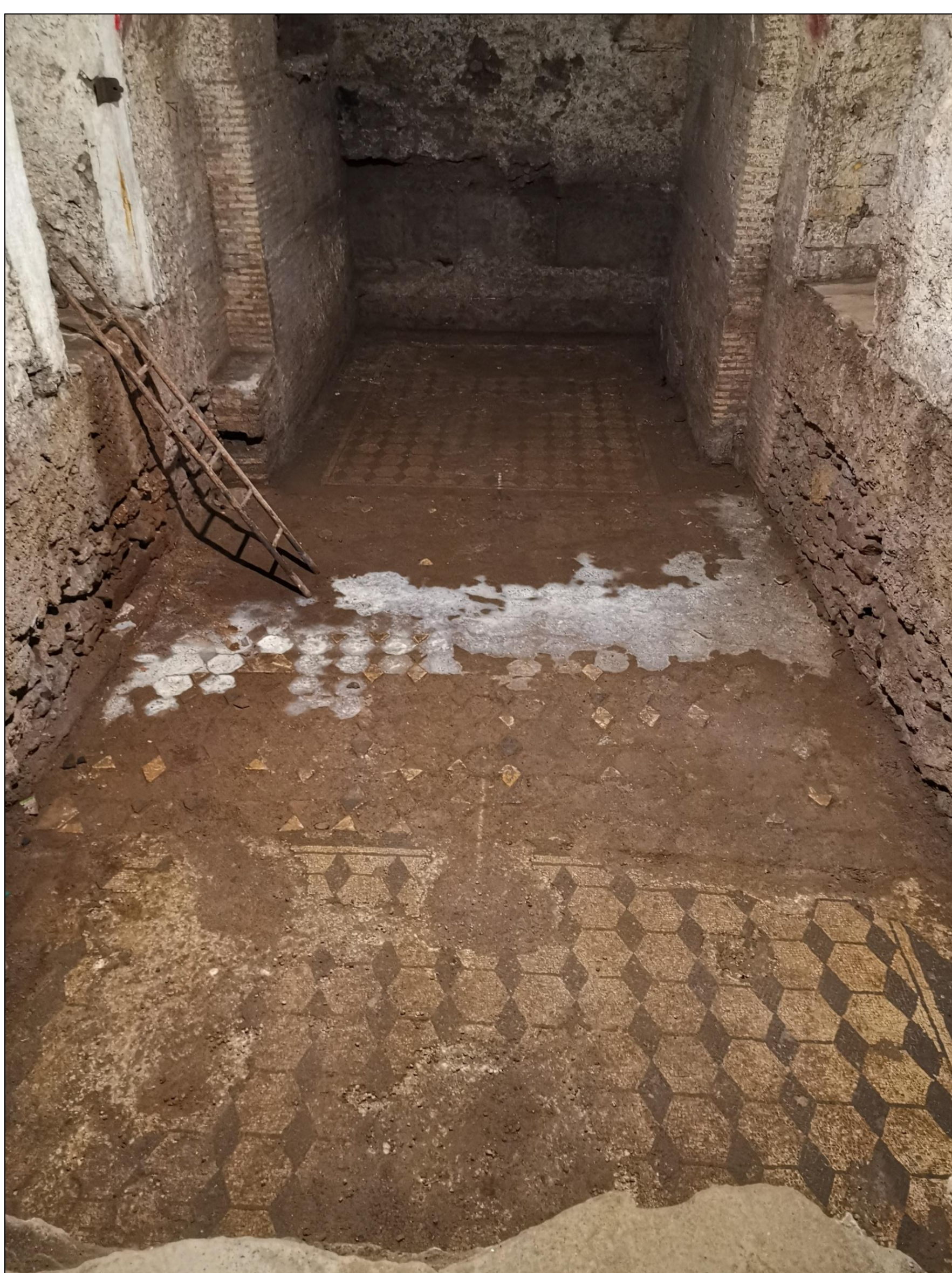
Figg. 4-5. Ambiente 2.