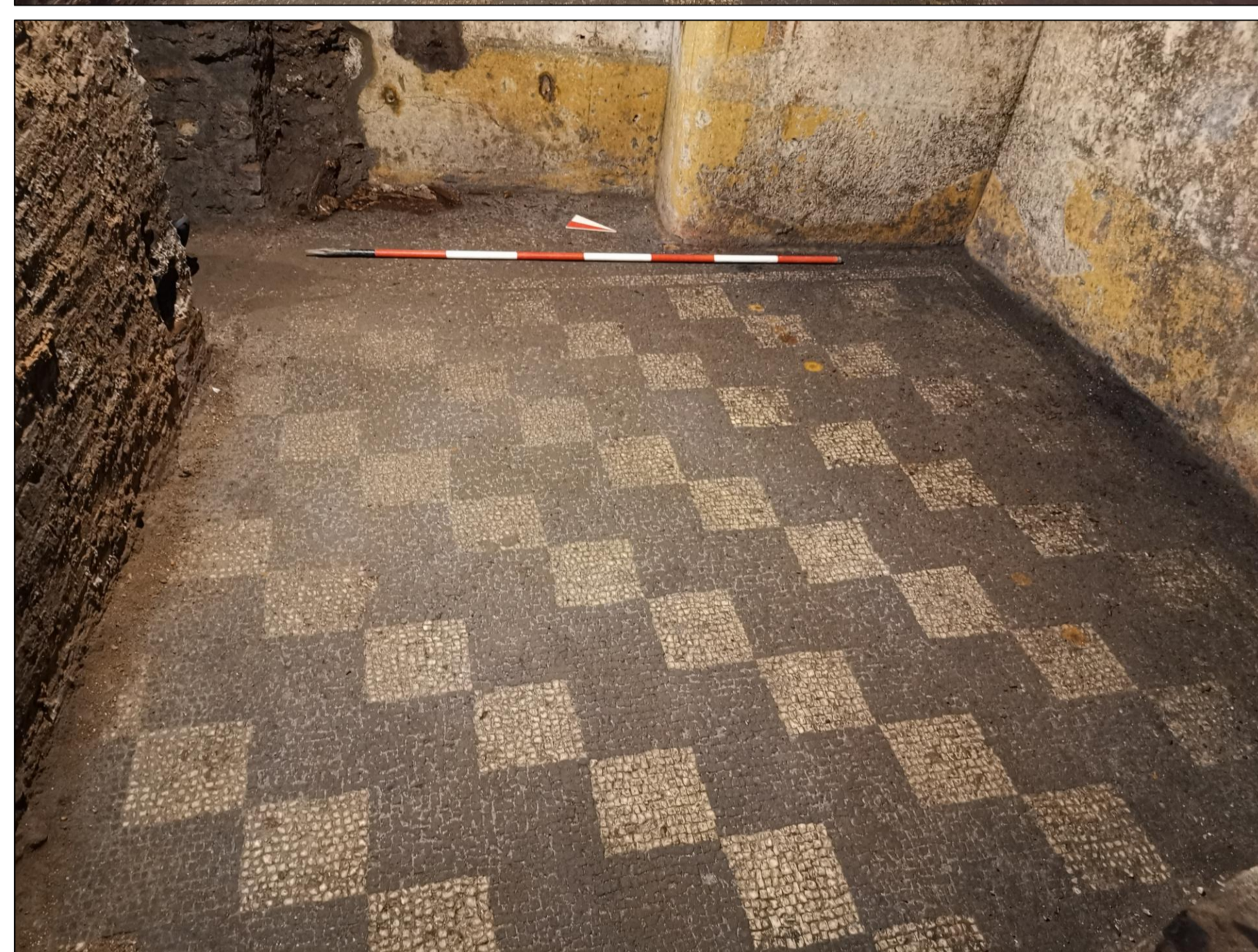
Figg. 2-3. Ambiente 1.